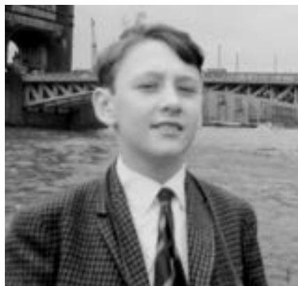
Me, aged probably 13 or 14, Tower Bridge on the River Thames, London.

Lamentablemente, los visitantes extranjeros no se han recuperado a los niveles previos a la pandemia, con un 30% menos que en 2019. Los visitantes canadienses también están