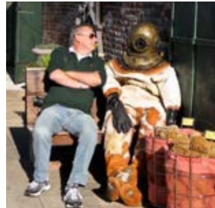
Me with a 'friend' in Appalachicola, just down the coast.

2019. Canadian visitors are also still 46% down on 2019. Tourism is still Florida's number one industry and is highest contributor to the general