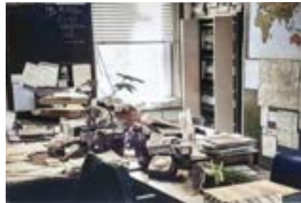
A travel agency in the late '70s - not a computer in sight!

la aerolínea y los hoteles para hacer todos los arreglos. Estuvimos increíblemente ocupados desde el día después de Navidad hasta alrededor de marzo. Luego, las cosas se calmaron hasta que los folletos de invierno, para el sol y el esquí en invierno, se