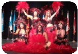
ORI MOTU Polynesian Dancers