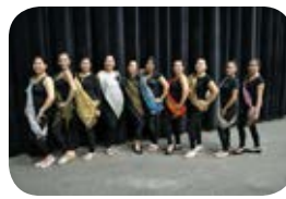
Filipino Dancers of Mobile Alabama