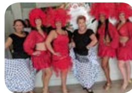
Gypsy Rhythm Dancers