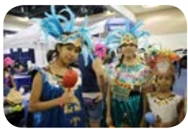
Un Poquito de México