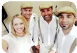
Música en Vivo - Live Music by ZONA LIBRE