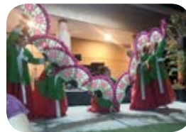
Korean "Mu-gung-hwa" Group